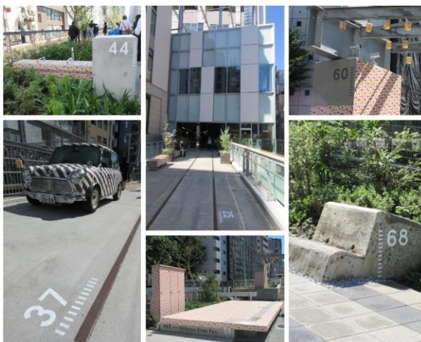
渋谷川周辺に見られる高架橋の柱番号

渋谷川周辺に広がるにぎわいの広場および憩いの空間には、番号がふられた様々なオブジェや歩道が見て取れる。これは、復元されたかまぼこ屋根のあるデッキ（旧東横線ホーム）から数えた高架橋の柱番号である。一見単なる旧渋谷駅の名残のように見えるが、開発関係者には「これらの番号をイベント開催時の目印や待ち合わせ場所として使用できるのではないか」という考えがある。お昼時には川沿いにキッチンカーが出ていたが、こういった番号を使用すると、例えば「今日は渋谷川沿いの37番で営業しています」といったようにSNS等で告知することができる。渋谷川沿いの