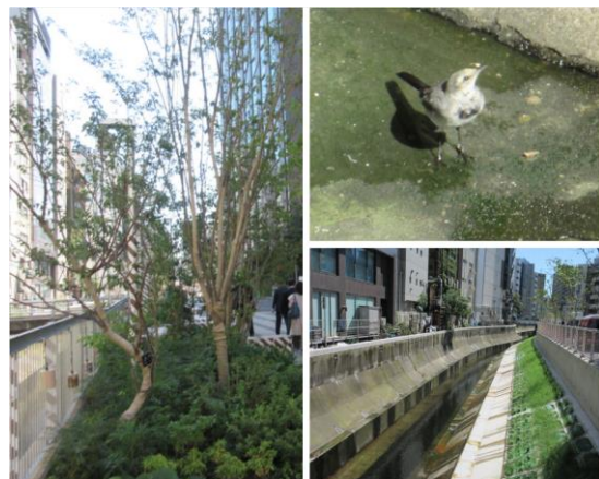
渋谷川周辺に設けられた緑のエリア

この渋谷川の再生は、結果として駅南街区のにぎわい創出や景観向上に貢献することとなったが、東京都心部などで顕在化しているヒートアイランド問題解決のための、自然エネルギー活用による環境負荷低減に向けた取り組みでもあった。街区間の連携による面的エネルギーネットワークを構築し、中長期的利用推進が望まれる未利用エネルギー(ビル排熱、清流復活水、生ごみ等)や自然エネルギー(太陽光、太陽熱)等を最大限に使用し、建築物の省エネ化および低炭素化に取り組んでいる。